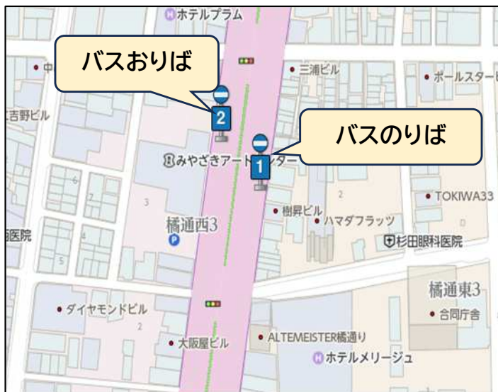
橋通三丁目バス停